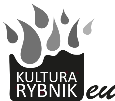
logo w wersji monochromatycznej

r: 177, g: 177, b: 177 c: 0, m: 0, y: 0 k: 30