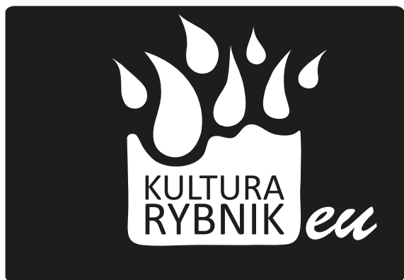
przykładowe zastosowanie logo na czarnym tle